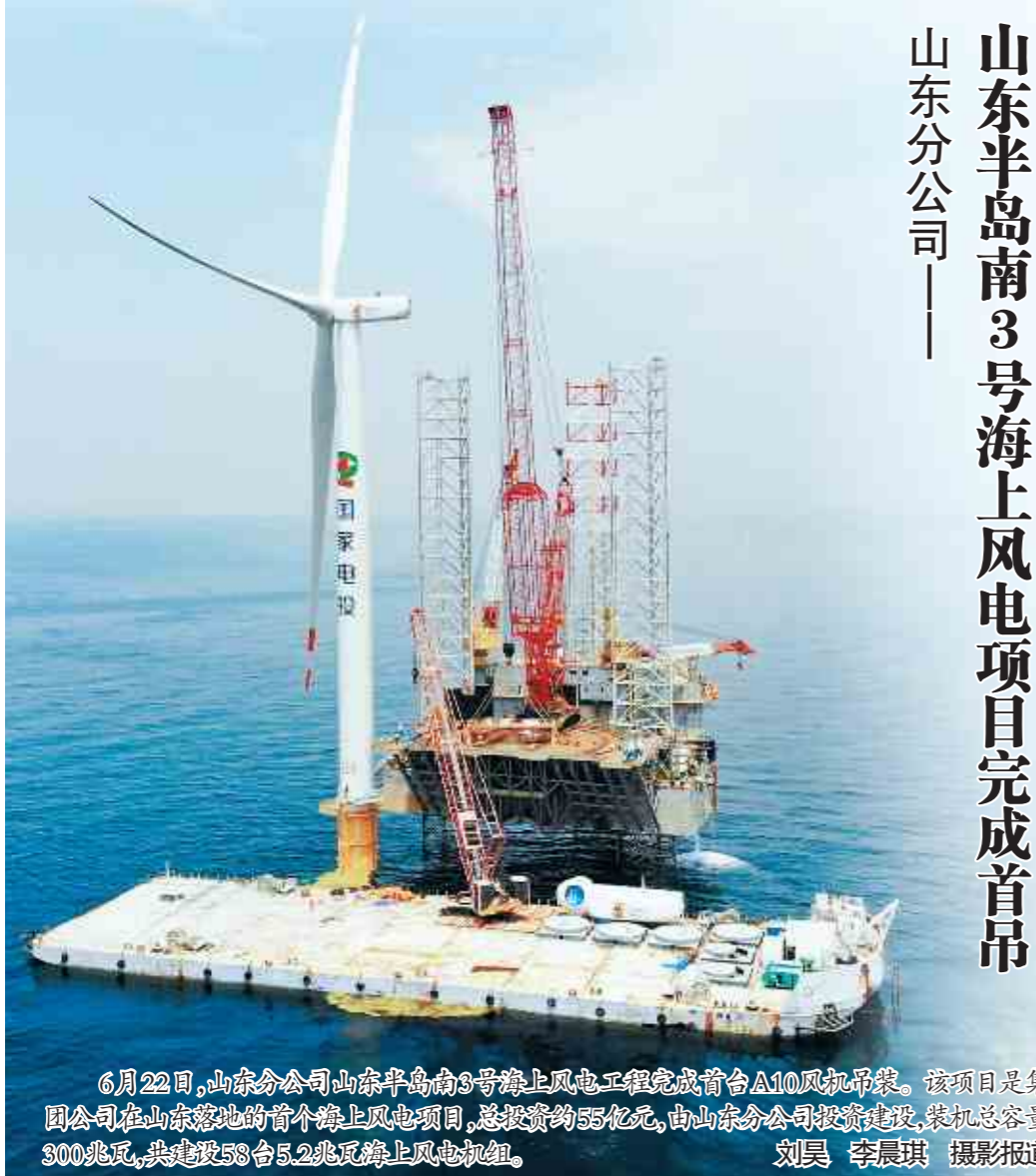
山东半岛南3号海上风电项目完成首吊

习贯彻《档案法》,全面落实《全国档案事业发展“十四五”规划》,奋力推进档案事业转型发展、高质量发展。会议强调,要弘扬创新精神,以建设“国家电投数字档案馆”为抓手,拓展数字化、智慧化应用场景,实现档案工作的数字化转型,不断提升档案工作现代化水平。