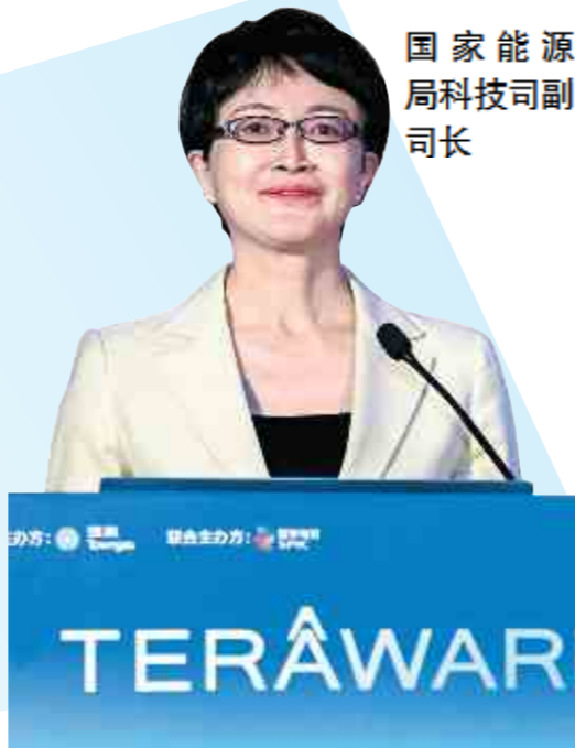
国家能源局科技司副司长

此次由国家电投与香港中华煤气联合举办的智慧能源创新大赛,面向未来、面向前沿,征集供能、能源需求、交通、能源互联网等多个重要方向的新技术、新方案,对于凝聚智慧能源领域优秀人才与团队智慧,推动国家能源战略的贯彻落实、促进智慧能源技术的提升、完善科技创新机制,具有积极作用。