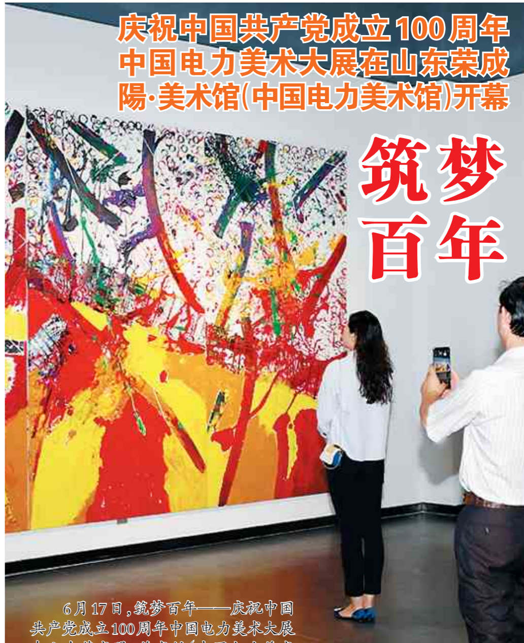
6月17日，筑梦百年——庆祝中国共产党成立100周年中国电力美术大展在山东荣成·美术馆(中国电力美术馆)开幕，图为参观人员在欣赏作品，拍照留念。