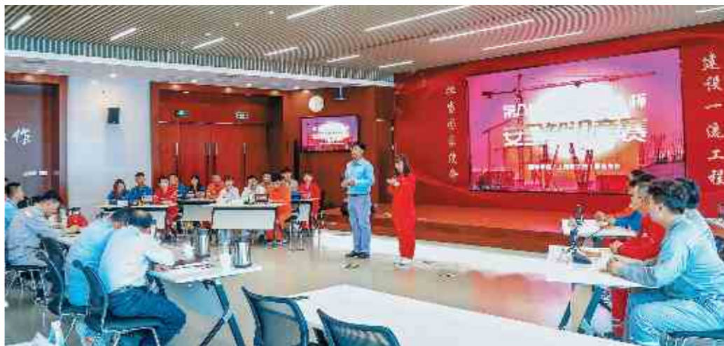
6月18日,国核示范和上海核院示范工程项目部联合举办第八届“国和一号”杯安全知识竞赛。围绕“落实安全责任,推动安全发展”安全生产月主题,竞赛以安全生产法律法规、电力建设安全规定、HSE国际标杆建设以及示范工程五星级班组建设等为知识点,设置必答题、抢答题、风险题和观众参与等多个环节。

江毅强调,集团公司作为能源央企,全力以赴做好建党100周年安全生产和电力供应保障工作,坚决守住不发生各类生产安全事故和重大敏感突发事件的底线,是对我们各级领导干部政治判断力、政治领悟力、政治执行力的重大考验。江毅要求,各部门、各单位要深入学习贯彻习近平总书记的重要指示和