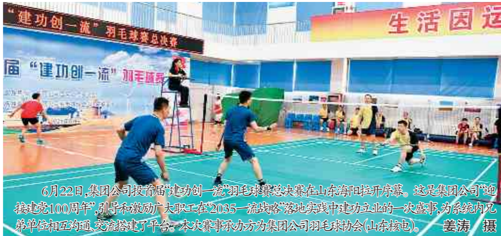
6月22日，集团公司团委组织“建功创一流”羽毛球赛总决赛在山东烟台拉开帷幕。这是集团公司迎接建党100周年，引导和激励广大职工在“2035一流战略”落地实践中建功立业的一次盛事，为系统内兄弟单位相互沟通、交流搭建了平台。本次比赛承办方为集团公司羽毛球协会(山东核电)。