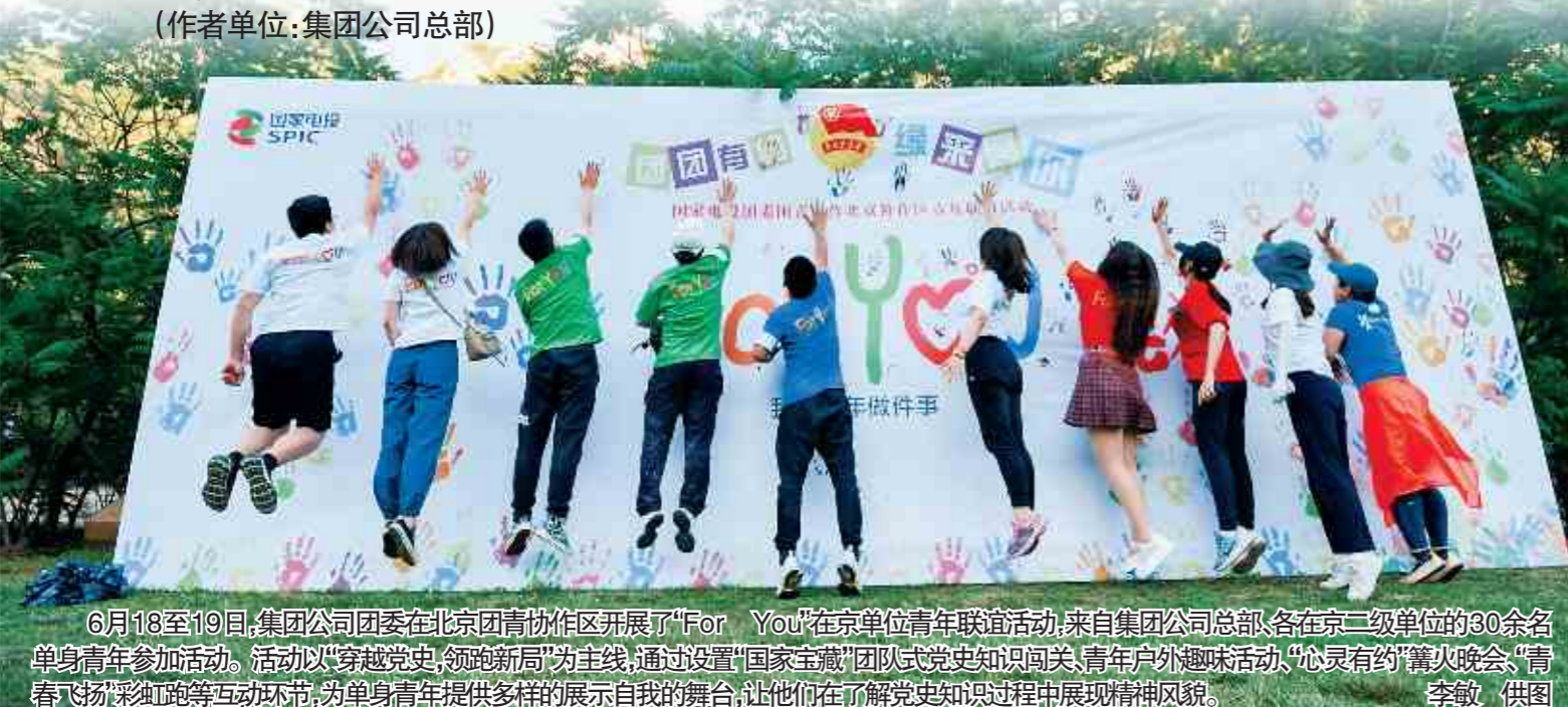
6月18至19日，集团公司团委在北京团青协作区开展了“For You”在京单位青年联谊活动，来自集团公司总部、各在京二级单位的30余名单身青年参加活动。活动以“穿越党史，领跑新局”为主线，通过设置“国家宝藏”团队党史知识闯关、青年户外趣味活动、“心灵有约”篝火晚会、“青春飞扬”彩虹跑等互动环节，为单身青年提供多样的展示自我的舞台，让他们在了解党史知识过程中展现精神风貌。