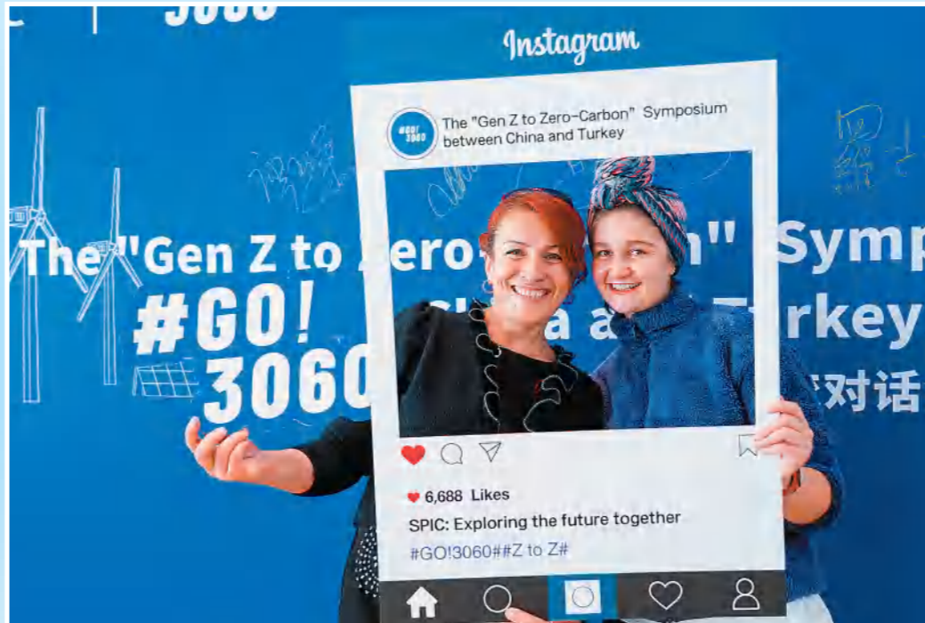
国家电投举办的#GO! 3060·中土高校“Z世代与零碳”交流对话会现场