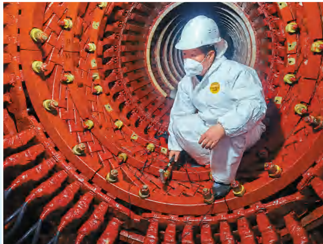
国家电投河南公司派出的技术人员在土耳其项目大修中进行电气模式振动试验