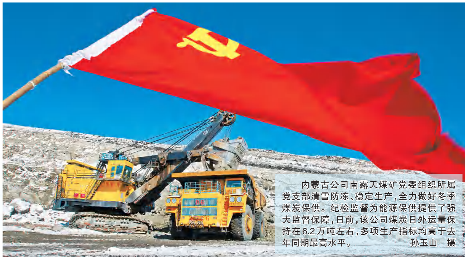
内蒙古公司南露天煤矿党委组织所属党支部清雪防冻、稳定生产,全力做好冬季煤炭保供。纪检监督为能源保供提供了强大监督保障,日前,该公司煤炭日外运量保持在6.2万吨左右,多项生产指标均高于去年同期最高水平。

打通全过程管理的“最后落地一公里”,集团公司把督办作为闭环管理的最后一环,扎实做好监督检查的“后半篇文章”。大监督联席会议办公室以“销号”管理督办联席会议行动项,建立年度监督计划台账,进行“滚动管理”,每月汇总、及时评估,定期跟进,督促计划落实。各部门按照监督职能联合督办、联合验收,确保真改实改,改出成效。今年,共督办两次大监督联席会议行动项11项,集团公司党组领导牵头任务8项,各部门牵头任务32项,整改任务100余项,保证了整改效果。