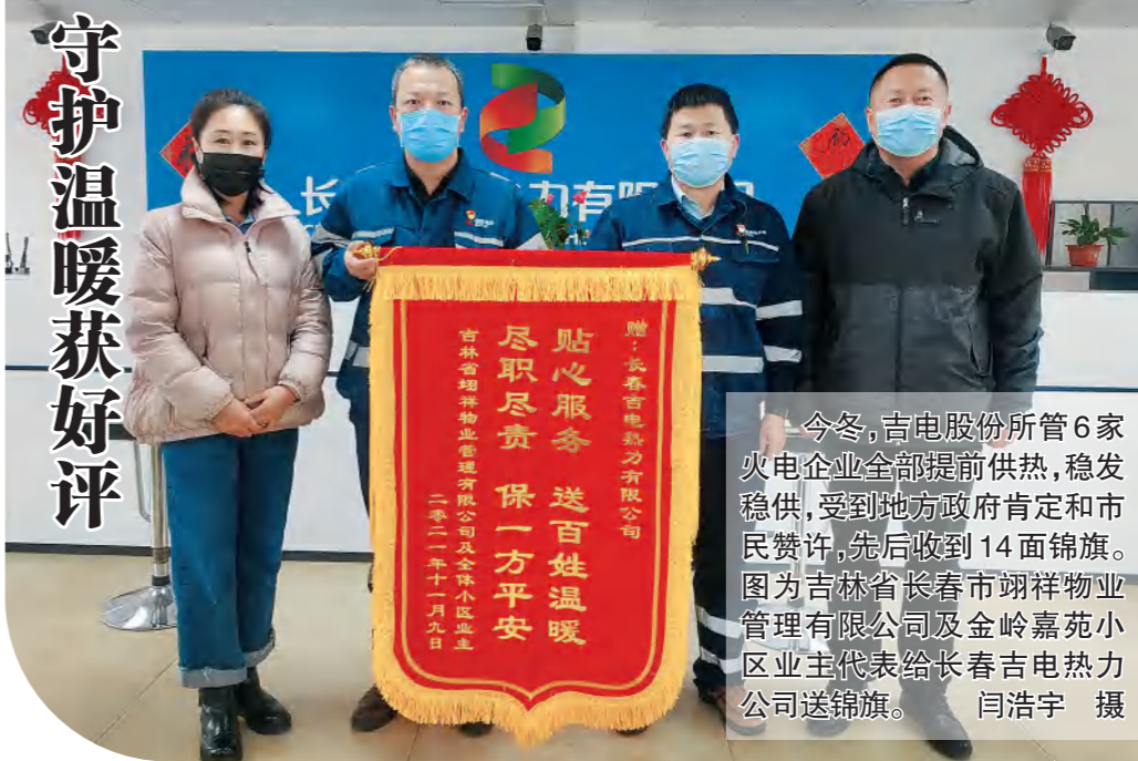
今冬，吉电股份所管6家火电企业全部提前供热，稳发稳供，受到地方政府肯定和市民赞许。先后收到14面锦旗。图为吉林省长春市翔祥物业管理有限公司及金岭嘉苑小区业主代表给长春吉电热力公司送锦旗。