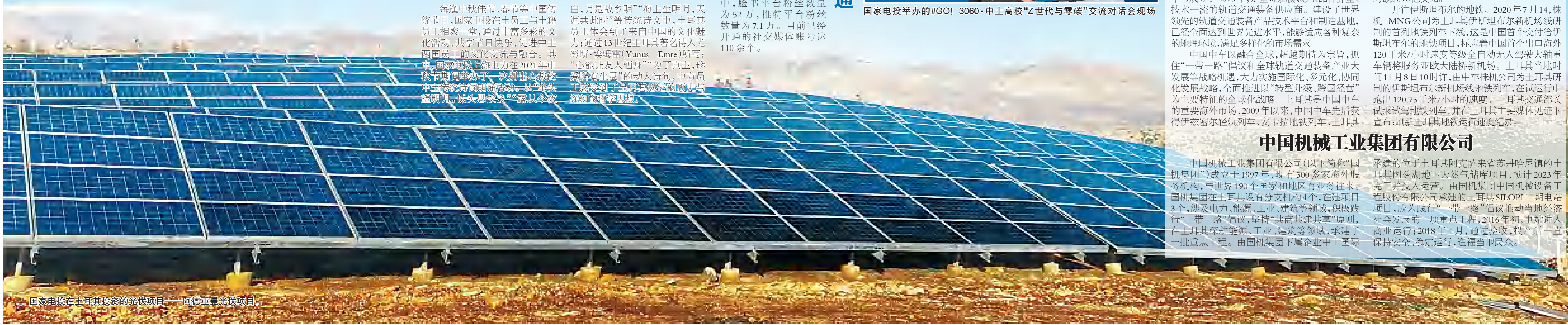
国家电投在土耳其投资的光伏项目——阿德亚曼光伏项目。