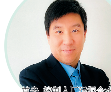
上海电力漕泾电厂 郁晨

上海电力漕泾电厂班组从污泥焚烧的过程管理、技术管理、制度管理三方面着手,摸索出适合漕泾电厂2×1000兆瓦塔式直流锅炉的污泥焚烧的管理方法,实现污泥环保性处理。